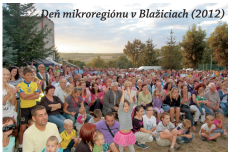
Deň mikroregiónu v Blažiciach (2012)

a vyhodnotenie je náročný proces, ale stojí za to, aby ulice, chodníky, verejné priestranstvá našich obcí boli krajšie, aby sa zrekonštruovali budovy ZŠ, MŠ i ostatné obecné budovy, aby sa vybudovali športové a detské ihriská, aby sa postupne vybudovali vodovody, kanalizácie, zrealizovali protipovodňové opatrenia, vystavali byty pre mladé rodiny.