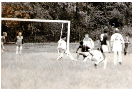
Futbalový zápas kedysi...