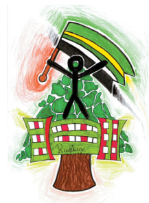
Pohľadnica Š. Jászai, víťaza 2. kategórie