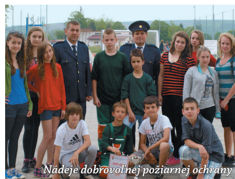
Nádeje dobrovoľnej požiarnej ochrany