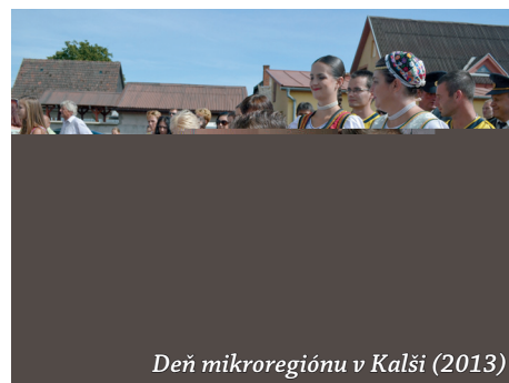
Deň mikroregiónu v Kalši (2013)

Chcem sa i touto cestou poďakovať všetkým, ktorí akýmkoľvek spôsobom prispeli k rozvoju našich obcí a mikroregiónu, za spoluprácu ďakujem štátnym orgánom a organizáciám, KSK, tretiemu sektoru i predstaviteľom všetkých