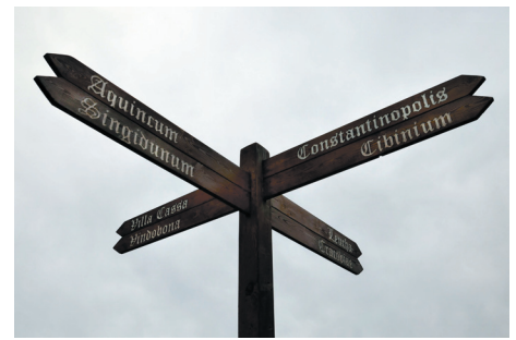
Replika historického smerovníka v parku pri kostole

Vieme teda, že na našom území bolo v tom čase veľmi rušno. Nemožno sa preto diviť, že Ruskov (vtedy Vruzca) bol miestom stretu rôznych národností, kultúr, vyznaní a rás. Ak ste sa niekedy zamýšľali, prečo sú Ruskovčanky