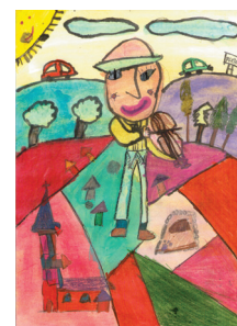
Pohľadnica M. Kocákovéj, víťazky 1. kategórie

Čestné uznanie: Rebeka Takáčová 5. ročník, Maxim Kotek 6. ročník